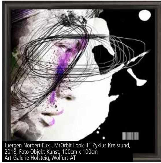
Juergen Norbert Fux „MrOrbit Look II“ Zyklus Kreisrund, 2018, Foto Objekt Kunst, 100cm x 100cm Art-Galerie Hofsteig, Wolfurt-AT