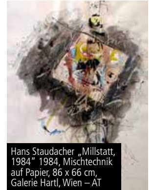
Hans Staudacher „Millstatt, 1984“ 1984, Mischtechnik auf Papier, 86 x 66 cm, Galerie Hartl, Wien – AT