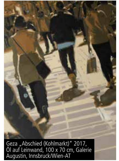
Geza „Abschied (Kohlmarkt)“ 2017, Öl auf Leinwand, 100 x 70 cm, Galerie Augustin, Innsbruck/Wien-AT