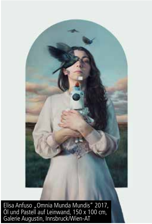
Elisa Anfuso „Omnia Munda Mundis“ 2017, Öl und Pastell auf Leinwand, 150 x 100 cm, Galerie Augustin, Innsbruck/Wien-AT