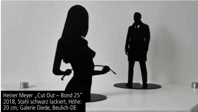
Heiner Meyer „Cut Out – Bond 25“ 2018, Stahl schwarz lackiert, Höhe: 20 cm, Galerie Diede, Beulich-DE