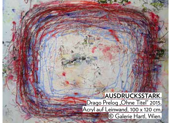
AUSDRUCKSSTARK. Drago Prelog „Ohne Titel“ 2015, Acryl auf Leinwand, 100 x 120 cm, © Galerie Hartl, Wien.